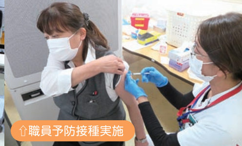
↑職員予防接種実施