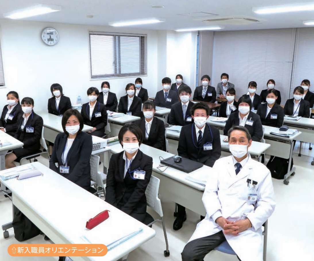
↑新入職員オリエンテーション