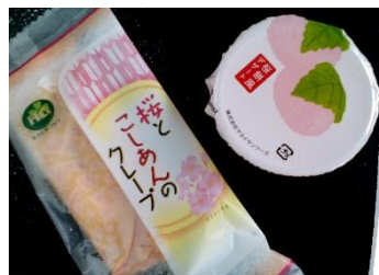
く桜の日く 桜とこしあんのクレープ 桜もち風デザート