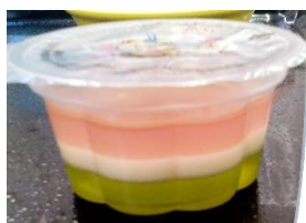
くひなまつりく 三色花ゼリー