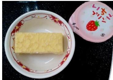
くホワイトデーく ミルククレープ 苺プリン