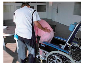
状態に応じた移乗練習