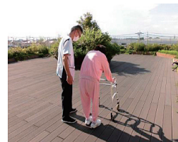
気分転換を兼ねた歩行練習

体調を少しでも健やかに保ち、自分らしい療養生活を送っていただけるよう、1日20分～40分程度のリハビリを行っています。個々にあったリハビリもお受けいただけます。