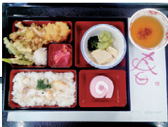
春の行事食（普通食）