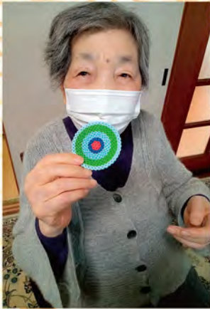
『コースター』 アイロンビーズで作りました