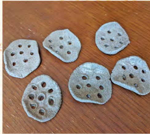
『陶芸作品』 箸置き完成！