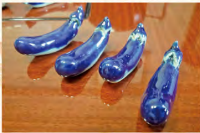
『茄子の箸置き』 昔陶芸をやっていました