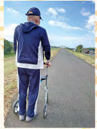
『やったぜ!!』 手術から2年、ようやく、 なんとか土手に登れたぜ!!