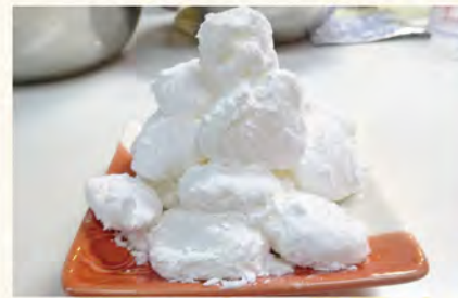
『お月見団子』 マシュマロ